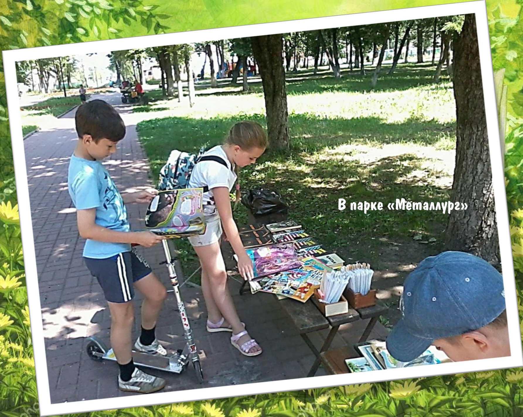
В парке «Металлурз»