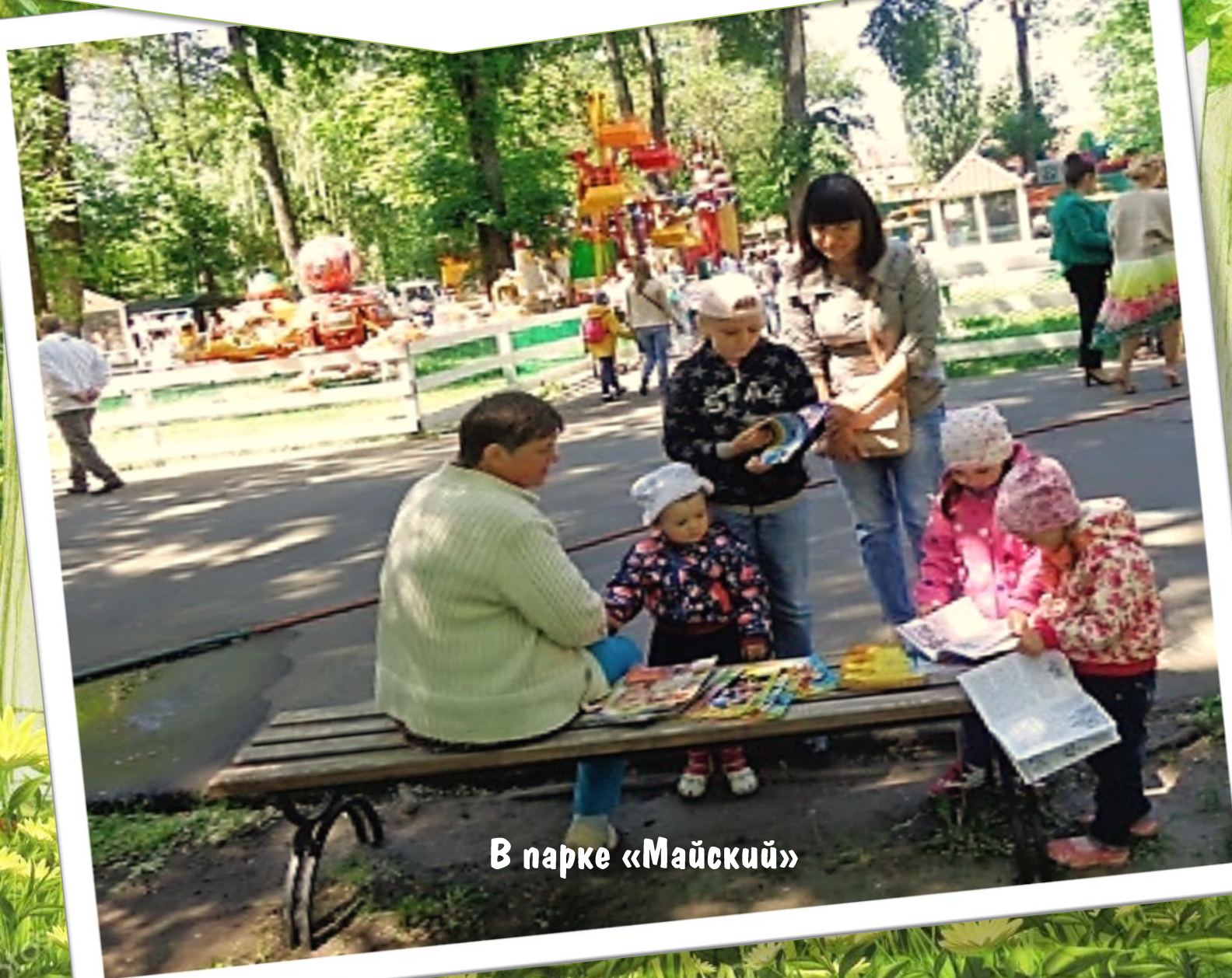
В парке «Майский»

Скамейки парков стали «литературными». Дети вместе с родителями читали здесь книги и журналы.