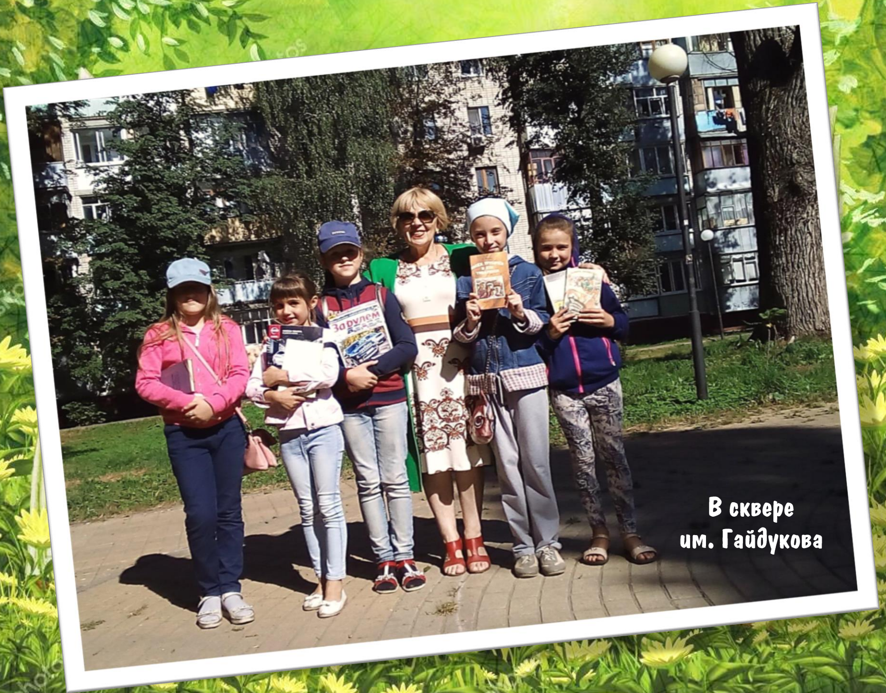
В сквере им. Гайдюкова